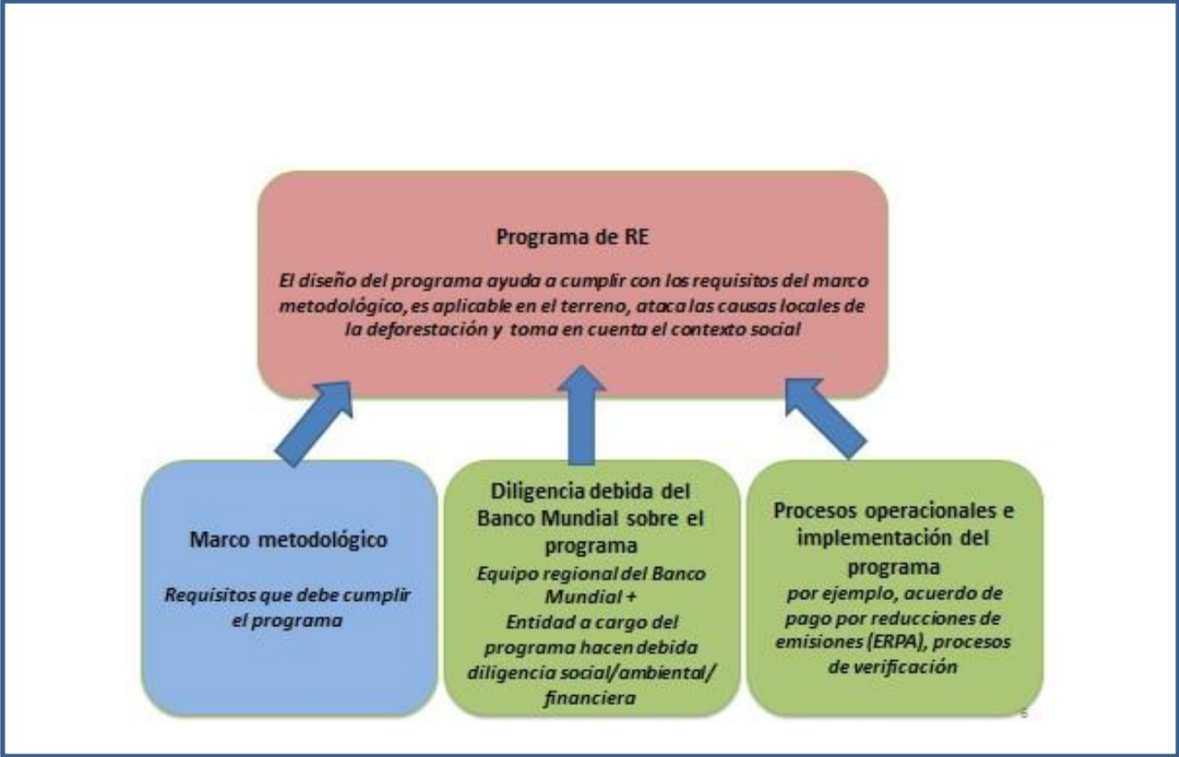
Gráfico 1.1: El marco metodológico es una parte de las orientaciones y del proceso de diligencia debida operacional para los Programas de RE