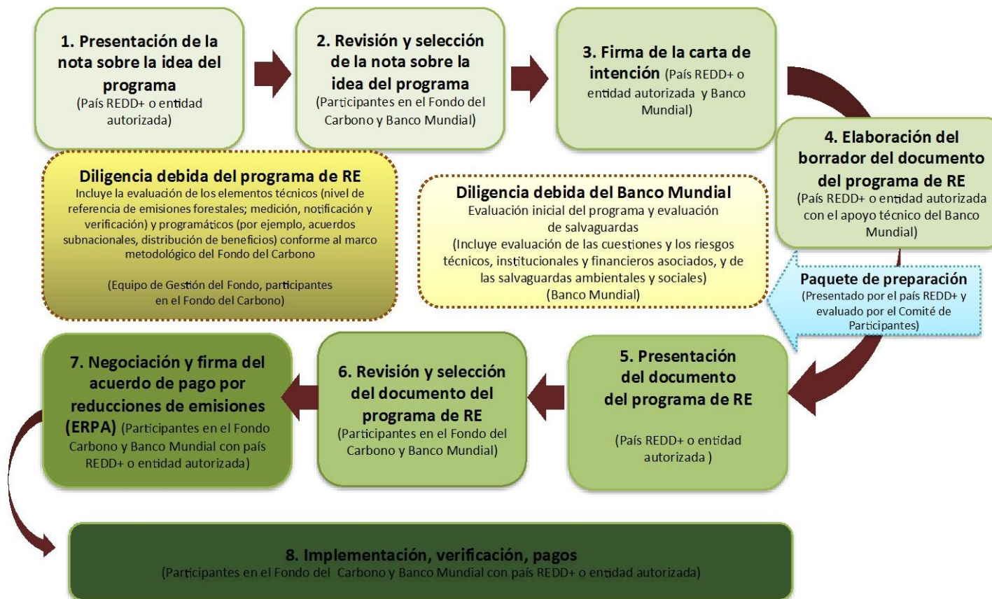
Gráfico 1.2: La función del Programa de RE del Fondo del Carbono en el proceso comercial