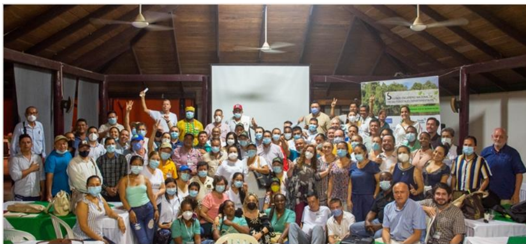
Figura 1. II Encuentro Nacional de Mesas Forestales. (Leticia, Amazonas, 3 a 6 noviembre 2021)