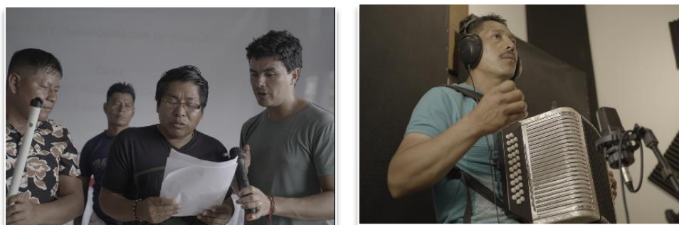
Figura 4. Sesión de trabajo para la composición y grabación de la pieza musical manejo de conflictos socioambientales río Atrato

A partir de esta ruta y se realizó un taller de producción artística de una herramienta lúdica pedagógica o pieza musical que contó con la participación de 15 artistas indígenas de las comunidades Embera y Wounnan de la Cuenca del Río Atrato. La pieza fue compuesta, musicalizada e interpretada desde las culturas, ritmos e instrumentos de las culturas embera y wounam en las lenguas embera y masmeu respectivamente.