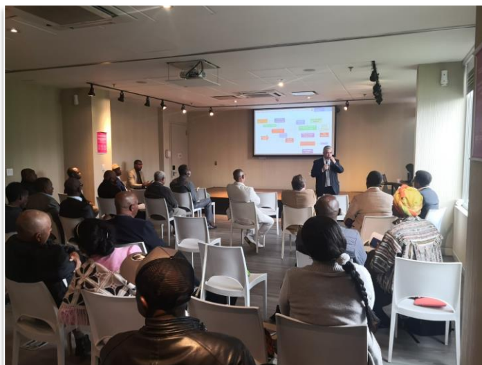
Figura 3. Segundo encuentro de delegados de las comunidades Negras Negras, Afrocolombianas, Raizales y Palenqueras (Bogotá, 7 y 8 de junio, 2022)

Para su implementación se realizaron jornadas de concertación con la Comisión Consultiva de Alto Nivel para comunidades NARP, en las sesiones del 29 de noviembre al 5 de diciembre de 2021 se sostuvieron diálogos con los delegados de la Subcomisión V quinta de Territorialidad, Vivienda, Saneamiento básico, Actividad agropecuaria, Ambiente y Minería de la Comisión Consultiva de Alto Nivel, para la definición de la ruta o metodología acordada con el gobierno para temas de contratación y logística para la cumplimiento de la sentencia STC4360-18 con la participación exclusiva de las comunidades NARP de la jurisdicción establecida. Actualmente, la ruta se encuentra en proceso de implementación, pendiente la articulación del operador de MinInterior con la organización definida por los consultivos para dar inicio a la ruta. El 7 y 8 de junio de 2022, con el apoyo del FCPF se llevó a cabo un segundo encuentro de delegados de las comunidades NARP con delegados de instituciones y organizaciones, con el fin de socializar y definir las aproximaciones de las Corporaciones Autónomas Regionales y Fondos Ambientales con las comunidades NARP, además se realizaron socializaciones en temas como la Agenda de Acción Climática el Programa de Pago por Servicios Ambientales, la Escuela Nacional de Formación Ambiental (SAVIA) y delitos ambientales orientado a comunidades NARP.