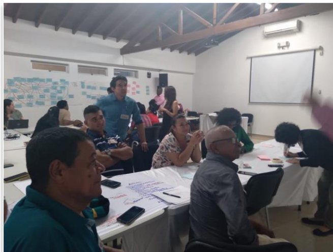
Figura 2. Espacio de dialogo para la caracterización de los conflictos socioambientales asociados a la deforestación (Medellín, 2 y 3 de junio, 2022).

Como resultado de este proceso se obtuvieron los siguientes productos: